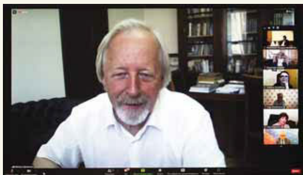
М.Д. Афанасьев, директор Государственной публичной исторической библиотеки России, президент Российской библиотечной ассоциации