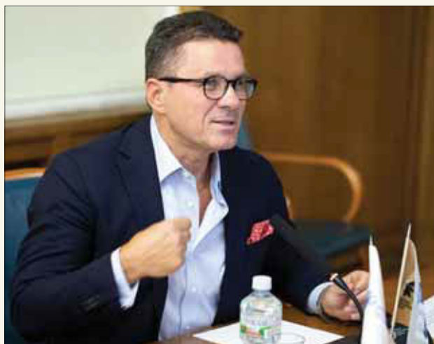
В.В. Дуда, генеральный директор Российской государственной библиотеки, вице-президент Российской библиотечной ассоциации

развития библиотечного дела в Российской Федерации до 2030 года», принятая Правительством Российской Федерации, примером такого договора или требуются иные/дополнительные усилия для его формирования и реализации?